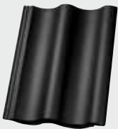
LONGLIFE matt schwarz (165) EasyLife schwarz TOP 2000S schwarz (365)