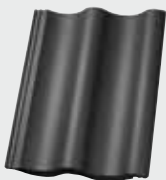
LONGLIFE matt granit (172) EasyLife granit TOP 2000S granit (372)