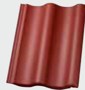
LONGLIFE matt neurot (108)