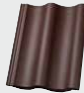
LONGLIFE matt dunkelbraun (126)