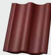
LONGLIFE matt bordeauxrot (103)