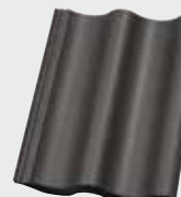
LONGLIFE matt dunkelgrau (145)

In der Farbwiedergabe sind aus drucktechnischen Gründen Abweichungen möglich.