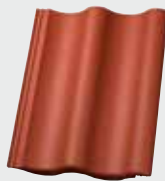
LONGLIFE matt ziegelrot (101) EasyLife ziegelrot TOP 2000S ziegelrot (301)